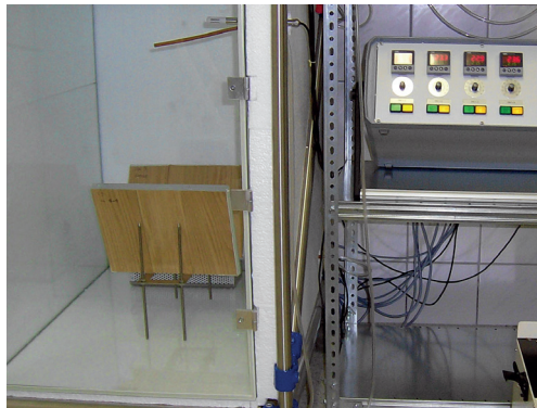
Bestimmung der Formaldehydemission

Entwicklungs- und Prüflabor Holztechnologie GmbH