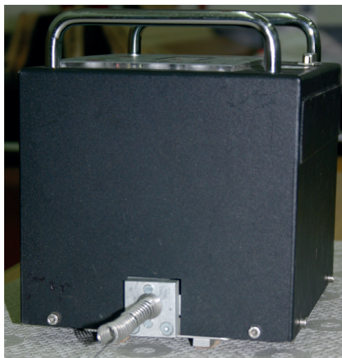
Bestimmung der Rutschfestigkeit eines elastischen Bodenbelages gemäß EN 13893