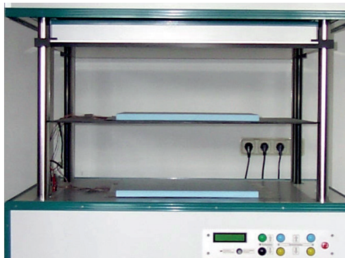
Bestimmung der Wärmeleitfähigkeit